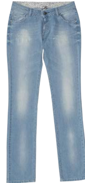
Jean 98% coton 2% élasthanne 110 €