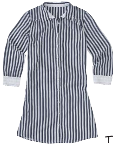
Tunique 100% coton 80 €