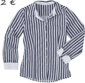
Chemisier 100% coton 82 €