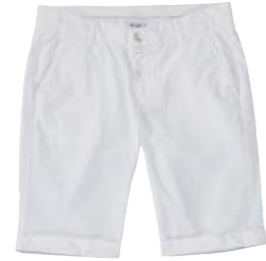
Short 100% coton 80 €