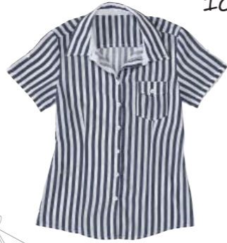
Chemisier 100% coton 75 €