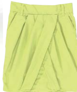
Jupe 100% coton 100 €