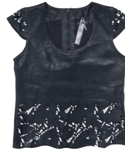
Top 100% cuir 275 €