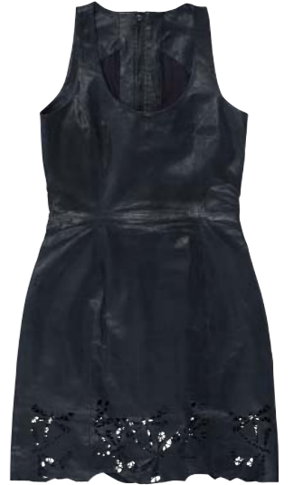
Robe 100% cuir 350 €