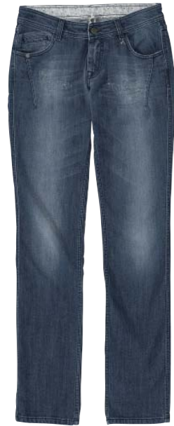
Jean 98% coton 2% élasthanne 110 €